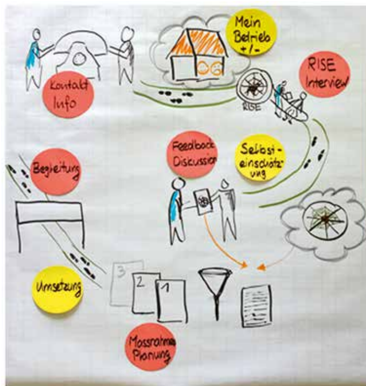
Ein typischer Beratungsablauf enthält Kontaktaufnahmen, Vorbereitung, Interview, Feedback mit Diskussion, Planung von Massnahmen und die Nachbetreuung der Beratung.

Ein Teil der Ressourcen wird durch Gesetze und Verordnungen (zum Beispiel Gewässerschutz, Tierschutz, Arbeitsrecht), Standards (zum Beispiel Richtlinien der Bio Suisse, IP-Suisse) und andere Regelungen (zum Beispiel Alpsatzung) geschützt. Ein ganz wesentlicher Teil hängt aber von den Entscheidungen und Handlungen des/der Betriebsleiters/-in ab.