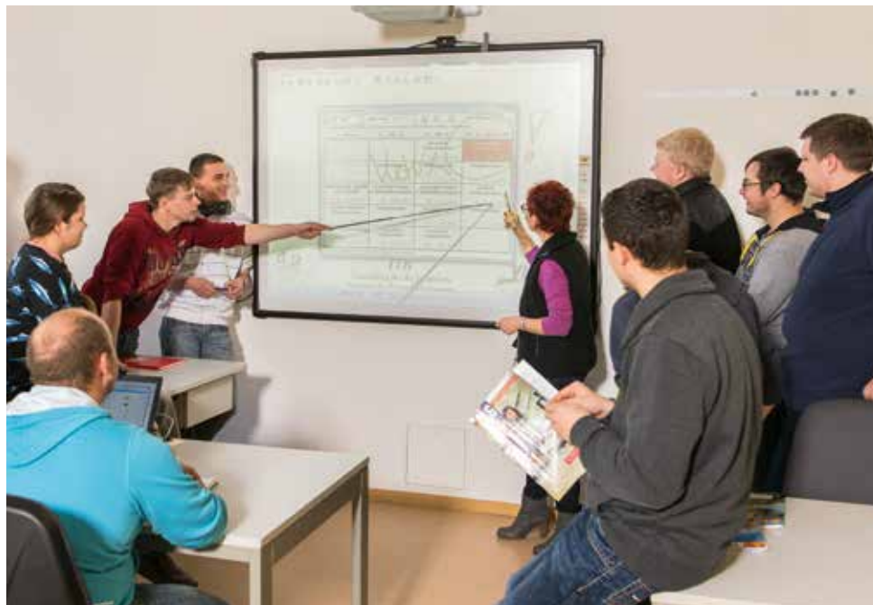
Gewünscht: Selbstständigkeit der Schüler im Unterricht

Resultats- und Lernerfolgskontrollen in Unterricht und Abschlussprüfung wurden im Sommer 2015 noch relativ lückenhaft in den dokumentierten Lernsituationen ausgewiesen. Obwohl ihre Planung auch für das Festsetzen der Vornoten erforderlich ist, erfolgte keine vollständige Integration der vorgesehenen Leistungskontrollen in die Situationsbeschreibungen. Im Sommer 2016 konnten hierbei Verbesserungen erreicht werden. Die Aufgabenstellungen selbst sind in der Regel in berufliche Problemstellungen eingebettet, sodass ein Praxis- und Handlungsbezug her-